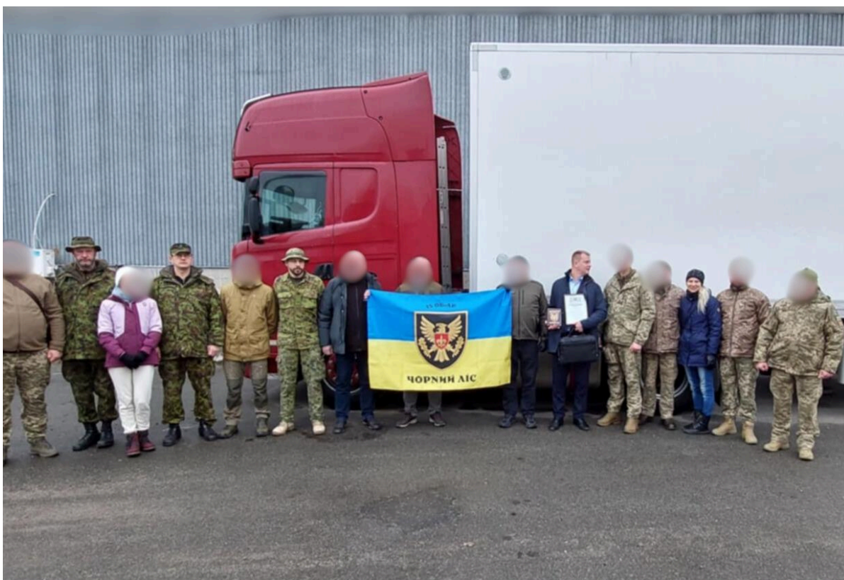
6. sauna üleandmine brigadile "Must Mets"